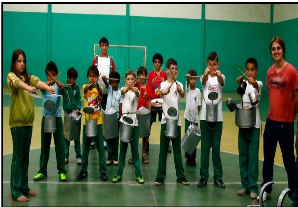
Aluno repassando o toque para os integrantes novos,