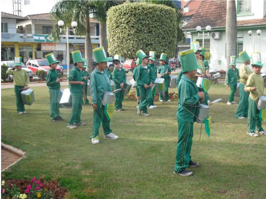
Apresentação ao público