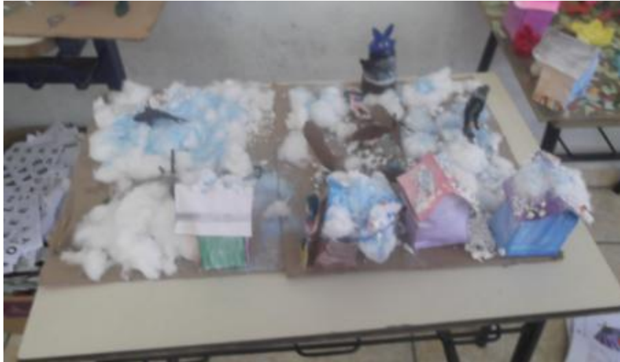
5.13 Maquete das Estações "Inverno" do 2ºAno;