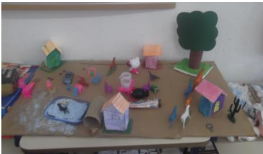
5.12 Maquete das Estações “Verão” 2ºAno;