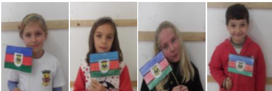
5.17 Alunos do 2º Ano com suas Bandeiras do Município;