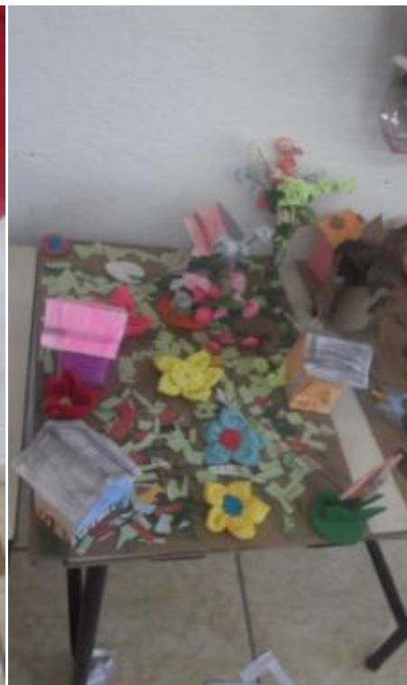
5.15 Maquete das Estações "Primavera" do 2ºAno;