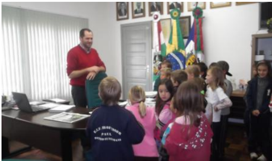
5.5 Visita ao Gabinete do Prefeito com as turmas do 1º e do 2º Ano;