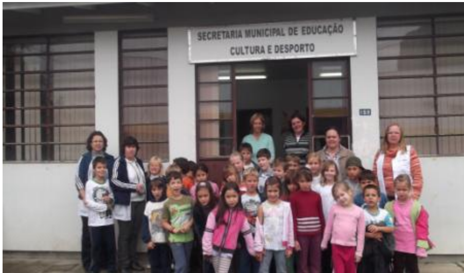
5.4 Visita à Secretaria Municipal de Educação com as Turmas do 1º e do 2º Ano;