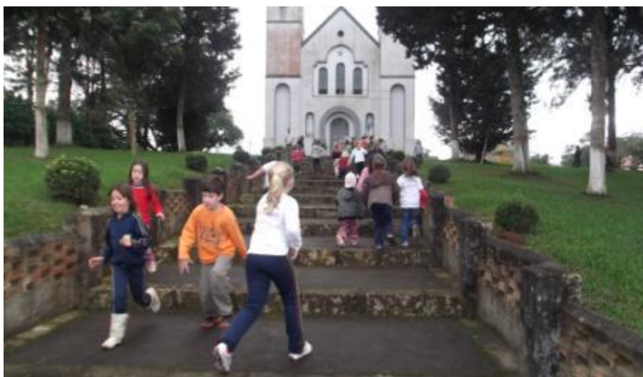
5.9 Alunos brincando em frente à Igreja da Comunidade do Caminho Pinhal;