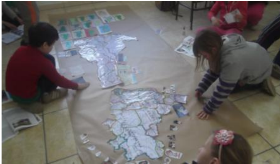
5.11 Alunos do 2º Ano construindo o Mapa do Brasil e de Santa Catarina;