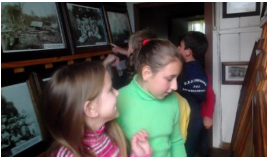
5.20 Alunos em visita à Casa do Imigrante observando Fotos Antigas que retratam um pouco da colonização do município;