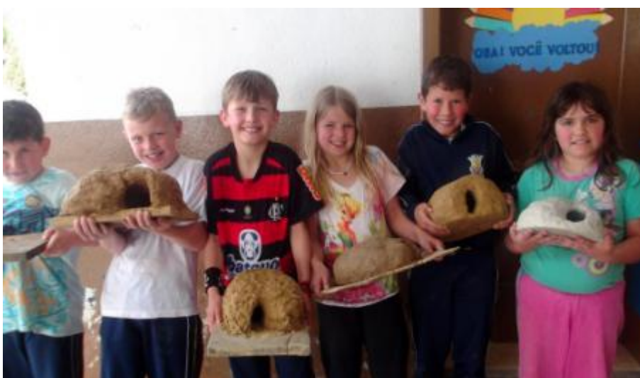
5.24 Maquetes da casa do João-de- Barro, Ave símbolo do município, 3ºAno.