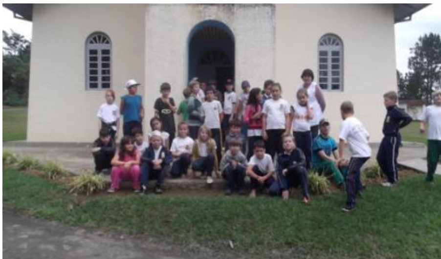
5.6 Visita à Comunidade de Rio Caçador com as Turmas do 3º, 4º e 5º Ano;