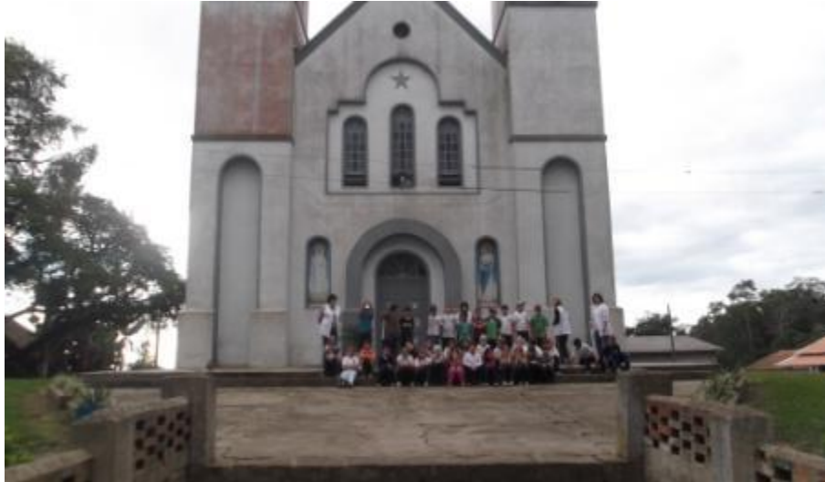
5.7 Visita à Comunidade do Caminho Pinhal com as Turmas do 3º, 4º e 5ºAno;