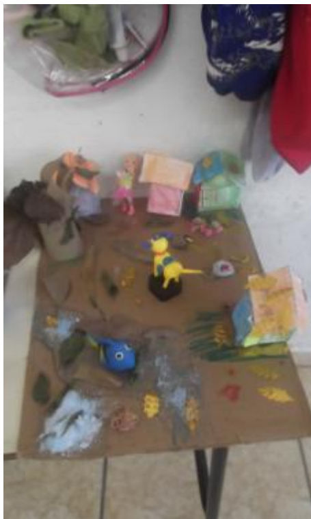
5.14 Maquete das Estações "Outono" do 2ºAno;