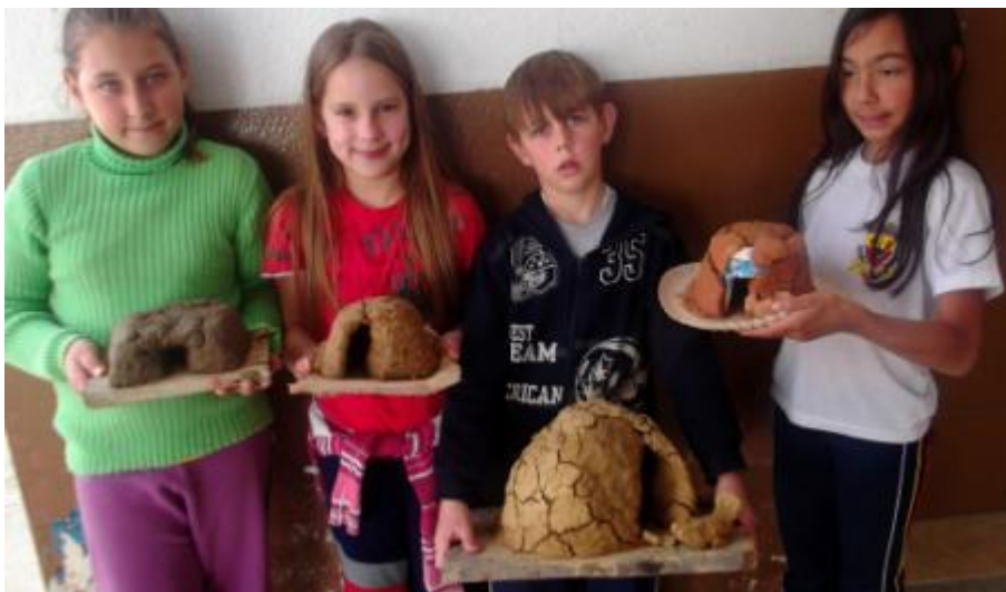
5.23 Maquetes da casa do João-de- Barro, Ave símbolo do município, 3ºAno;