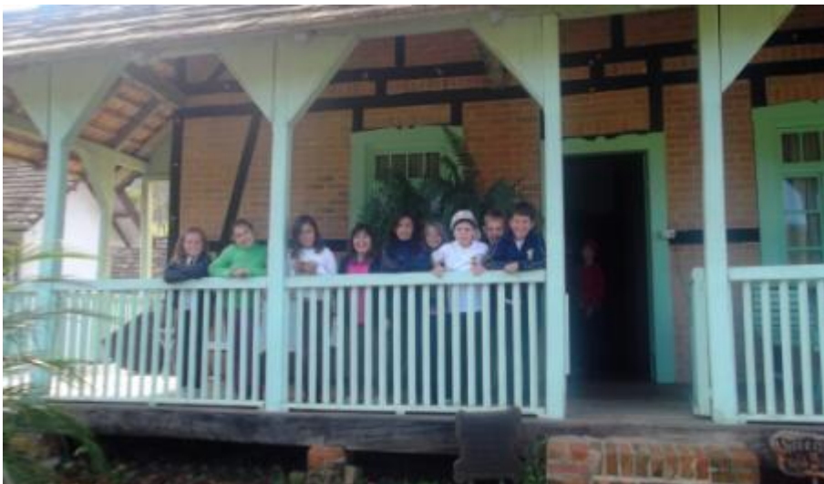
5.21 Alunos do 3º Ano em visita à Casa do Imigrante;