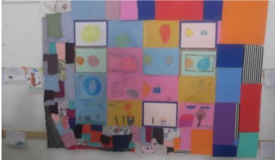
5.10 Colcha de Retalhos construída pelos alunos do 2ºAno com o tema “Sistema Solar”;