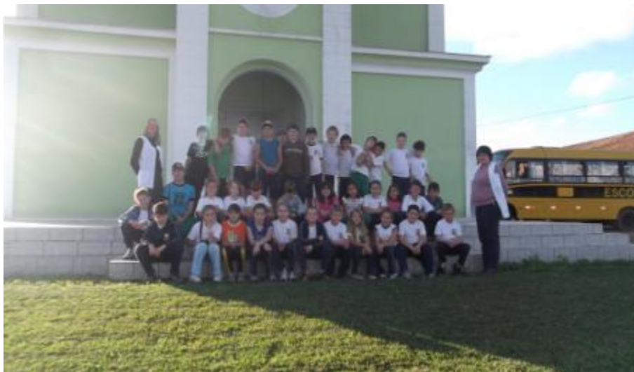
5.8 Visita à Comunidade de Caminho do Morro com as Turmas do 3º, 4º e 5ºAno;