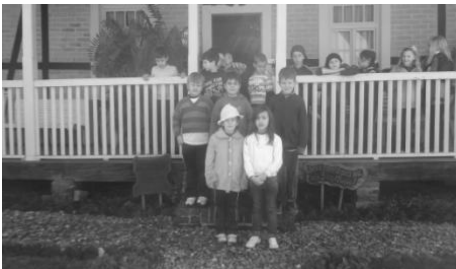
5.18 Visita à Casa do Imigrante, alunos do 1º e do 2º Ano;