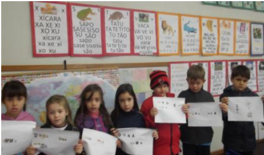
5.16 Alunos do 1º Ano formando o nome de nosso Município com letrinhas;