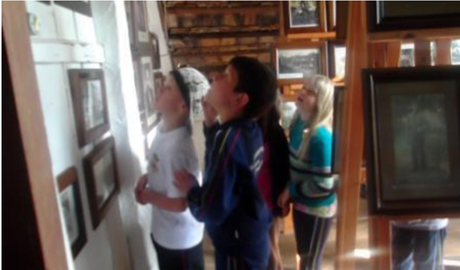
5.19 Alunos em visita à Casa do Imigrante observando Fotos Antigas que retratam um pouco da colonização do município;