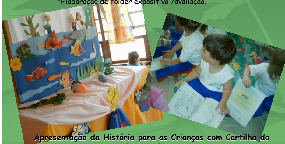
Apresentação da História para as Crianças com Cartilha do Projeto Piava